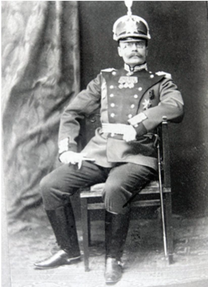
كۆلۈنپىل ئەلىكساندر ئىياس

كۆلۈنپىل ئىياس لە ۱۳ى ئۆكتۆبرى ۱۹۱۲ گەيشتە سابلاغ و لە لايەن سەردار موھەممەدھوسەين خانى موكرىي حاكىمى شارهكەوھ پيشوازيهكى گەرمى لى كرا. ئەو وەك ئۆتۆرىتە لە دەستدرىژىكردى توركەكان بۆ سەر خاكى ئيران توورە بوو و بەو شىوھىە نارەزايى خۆى دەردەبرى. توركەكان ئەو كارەيان بە دژايەتتى خۆيان لىك دايەوھ و قىنيان لى ھەلگرت.