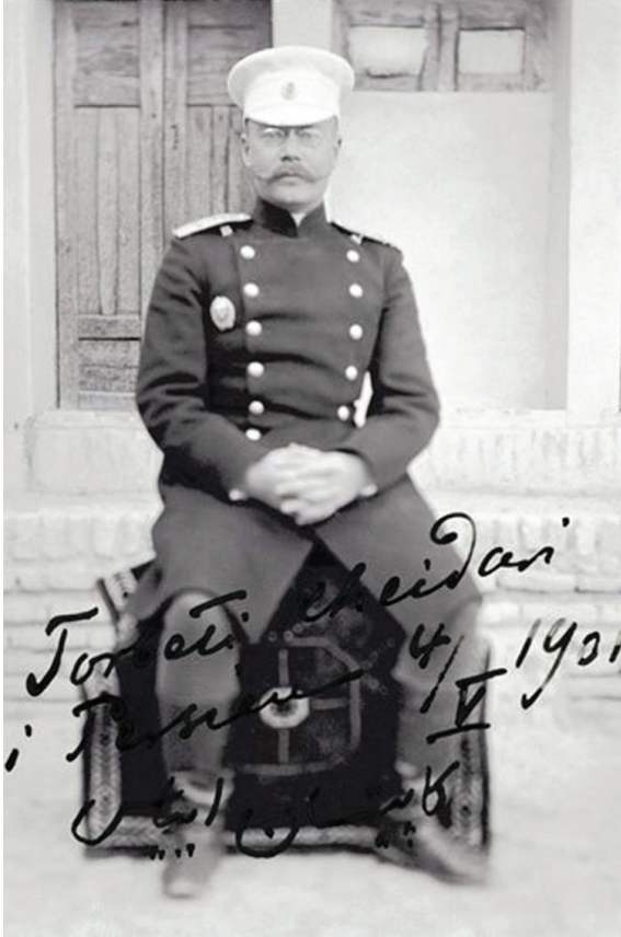
وېتەيەكى ئەلىكساندر نياس بە واژۆي خۆيەو ئەرشىفى مۆزەخانەي سەن پترزبورگ

لە ۱۹ ئىيۇن ۱۹۱۴، ئەلىكساندر نياس كە پېشتەر ئەرشىف و كەلوپەلە تاييەتەكانى خۆي بۆ تەورېز بەرى كىرەبوو، ئاگادار كرايەووە كە ۸۰۰ عەسكەرى تورك و ۶۰۰ چەكدارى كورد لەگەل چەندىن شېخ و مەلادا كە ئالاي سەوزى ئىسلاميان ھەلداو، بە ھاواری ئەللاھوئەكبەر گەپشتوونە نىك سابلاغ. كۆنسول پىرىارى دا شارەكە بەجى بىلى. ديارە بەرلەوہى لە شار بچىتە دەر، سەردانى مېسىئونى لۆتېرىي ئەمىركاي كىر و پېشنىارى پى كىرەن لەگەل ئەو برون. بە وتەي كەشېش لۆدېك ئۆلسن فاسوم، سەرۆكى مېسىئونەكە، ھەرچەند بارودۆخەكە