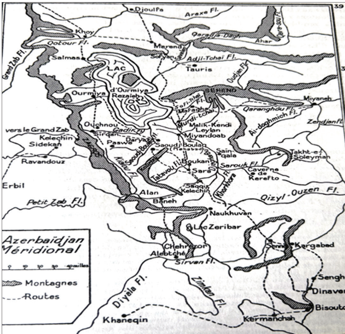
نهخشی ناوچه ی موکریان؛ بروانه کتییی بازیل نیکیتین، کورده کان، لیکۆلینه و به کی کۆمه لئاسی و میژوویی، ل ۴۱

داریک دا و بردیانه مهراغه تا لهوی خه لکی پی بترسیین. وا وی دهچی که نهو بوچوونه دروستتر بیت، له بهر نهوهی که هیزی تورک و کورد به ری مهراغه دا بهره و تهو ری وهری که وتن. هه رچو نیکی بووبی، سه ری نهو مروقه چاره ره شه قهت نه دو زراوه و تهرمه که هیشی که له نزیک رووباری جه غه توو نیژرابوو، وه بهر تهو ژمی ئاوی چومی کهوت و بو هه میشه بیسه روشوین بوو. مۆسکو نهو کاره ی شهرمه زار کرد و وا وی دهچی که سویندی تۆله سه ند نهوه ی خواردییت.