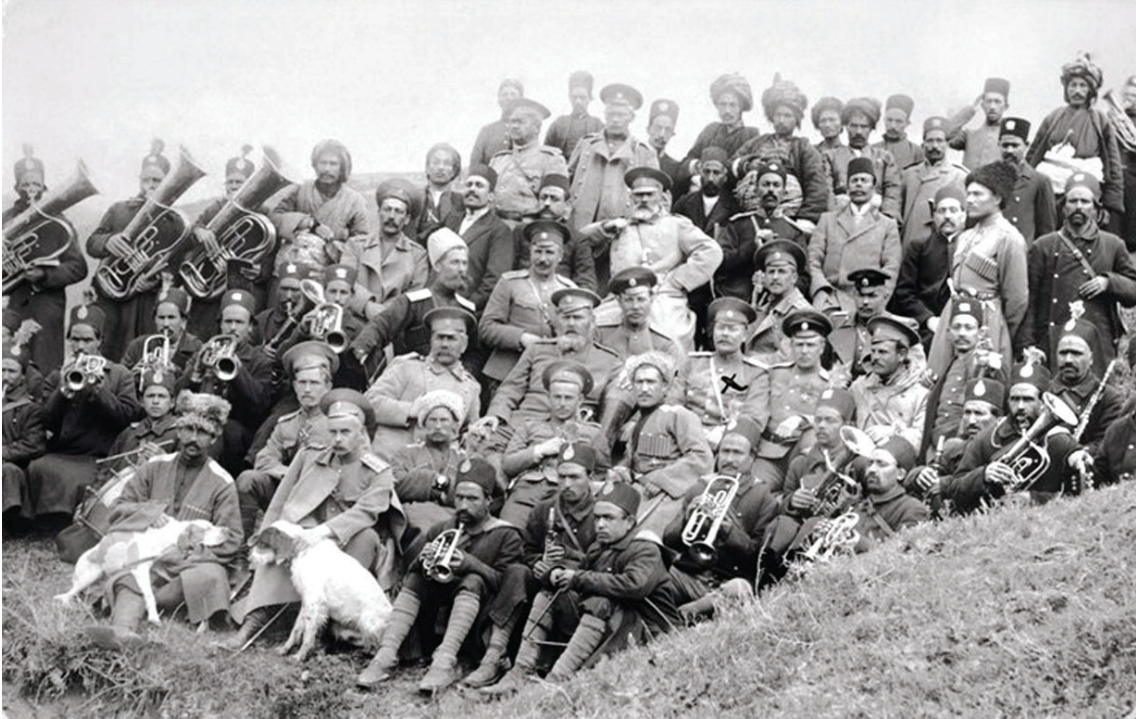
دەستەپەك لە ئەفسەرانى رووس لە ئىراندا، وىتەگر ئەلىكساندر ئىياس، ئەرشىفى مۇزەخانەى سەن پترزبۇرگ

بىجگە لە رووسيا و برىتانيا و فەرەنسا، ئەلمانىايش چاوى تەماعى لە سەرەوت و سامانى رۆژەهەلاتى ناوەراست برىوو. پرۆژەى درىژکردنەوہى هەيلى ئاسنى بىرلین-ئەستەنبوول-بەغدا بۆ خانەقین و لەویشەوہ بۆ تاران، كە سالى ۱۹۰۳ لە لاين ئەلمانىيەكانەوہ پىشكەش كرا و بە پرۆژەى «شۆمەن دۆفپىرى بەغدا» ناسراوہ، لە پىناو ئەو مەبەستەدا بوو. ئامانجى سەرەكىى ئەو پرۆژەى نوپکردنەوہى هەيلى ئاسن لە بەشى رۆژەهەلاتى ئىمپراتورىاي عوسمانى بوو كە بەتايەت بۆ پاراستنى پىوہندىيە سەربازىيەكان لە نيوان مىسر، عەرەبستان، مىزۆپۆتاميا، سووریا و فەلەستىندا پىويست بوو. دەرەفەتىكى گەورەيش بوو بۆ ئەوہى ئەلمانىايش بىتە ناوچەى نفووزى فەرەنسا و برىتانيا و رووسياوہ و لە بازارى بەرھەمھىنانى نەوت لە مىزۆپۆتاميا و ئىراندا جىگايەك بۆ خوۆ بدۆزىتەوہ و بەو شىوہىە خوۆ لە كرىنى نەوتى ئەمريكا رزگار بكات. ھەرەوہا لە رووى ستراتىژىكىشەوہ بتوانىت لە ناوچەى كەنداودا جىگىر بىت و لە ئەگەرى شەر و گەمارۆى دەريايىدا،