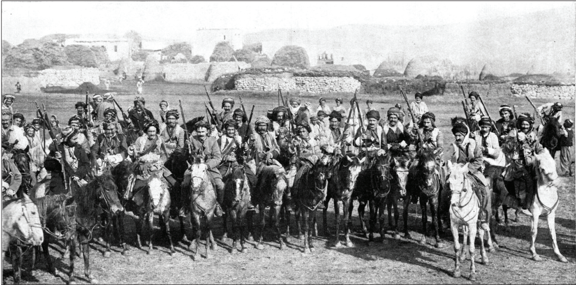
۱۹۱۶؛ چەكدارانى كورد لە شەرى رووسەكاندا

تەقەمەنىي خۆيان پى بوو، هەرچەند ئەوانىش هەر شەرى پارتىزانىيان دەزانى و لە شەرى نىزامى و پىادەسەواردا هەرەيان لە برەى نەدەكردەوه. بە گشتى چونكە ژمارەيان زۆر بوو، سوپای توركىيان بەهێتر لەوهى كە هەبوو دەهێنايه بەرچاو و دوژمنىيان لى دەپرىنگاندهوه.