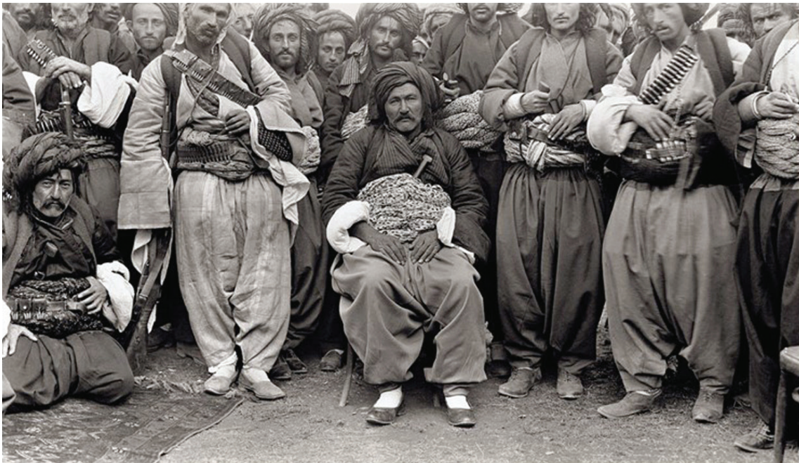
عەشیرەتى پيران، ویتە ئەلیكساندر ئياس، ئەرشىقى مۆزەخانەى سەن پترزبۇرگ

له ماوهى نىك به دوو سالددا كه كۆلۆنيل ئياس كۆنسولى سابلانغ بوو، چەند ئەركىكى بەنرخى بە ئەنجام گەياندا. يەك لەوانە گەشتىك بوو بۆ نيو عەشیرەتەكانى مەنگور و مامەش و پيران كه له پوژئاواى شارەكە دەژين. دياره مەبەستى سەرەكى لهو كارە بەرپۆبەردنى سياسەتى رووسيا بۆ پىگىکردن له پەيوەستبوونى ئەو ھۆزانە بە توركەكان بوو. كۆلۆنيل ئياس له پاش گەفتوگۆ و ئاخفتنىكى زۆر توانى سەرۆك ھۆزەكان بىنیتە سەر ئەو قەناعەتە كه دەست له كاروبارى يەكتر وەر نەدەن و دەستدرىژى نەكەنە سەر شوپى ژيانى يەكتر و له ئەگەرى كېشەدا داواى ناوبرىوانى له ئەو بكەن.